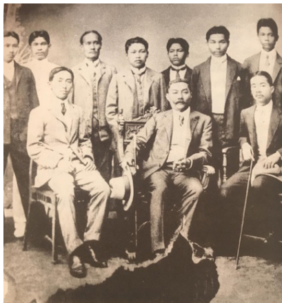
ภาพที่ 2 หลวงประดิษฐไพเราะ (แถวยืนคนที่ 4 จากซ้าย) ตามเสด็จสมเด็จพระเจ้าบรมวงศ์เธอ เจ้าฟ้ากรมพระยาภาณุพันธุวงศ์วรเดช และนำอังกะลุง เครื่องดนตรีของชวากลับมาเผยแพร่ในประเทศไทย